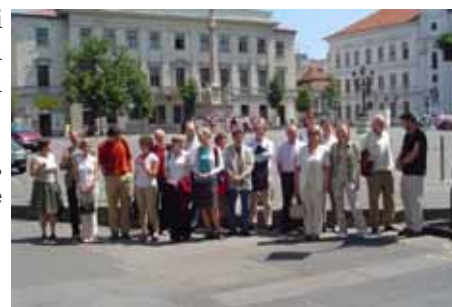
KS Seagulla na centralnym placu w Győr