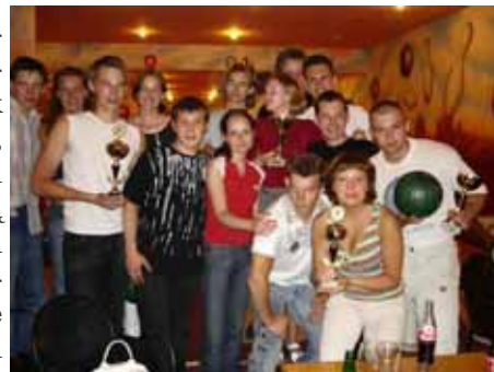
Młodzież w trakcie turnieju w kręgle. Oprócz pracy był też czas na relaks.

edukacyjny. Zrobiony przez młodych i dla młodych, ma przedstawić w interesujący sposób, jak żyją rówieśnicy w innych krajach, jaka jest ich historia, tradycja i kultura. Innym działaniem będą warsztaty szkoleniowe dla młodych przedstawicieli ERB, których celem ma być integracja i wspólne zrozumienie, a trwałym rezultatem powołanie Grupy Młodzieżowej jako platformy inicjującej kolejne wspólne inicjatywy i projekty.